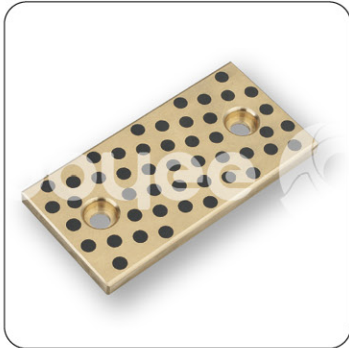
●运动方向为长度方向

请从适用的长度、宽度、厚度中选择零件号 (例)宽28mm、长度150mm的情况下